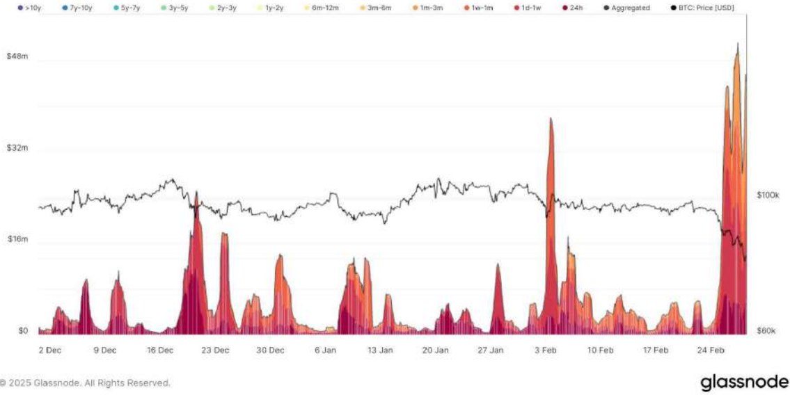
BTC: Realized Loss by Age

Bitcoin'in 80.000 doların altına gerilemesiyle birlikte 28 Şubat'ta toplam 685 milyon dolarlık gerçekleşmiş zarar kaydedildi. Verilere göre, en büyük kayıplar en yeni yatırımcılar tarafından gerçekleştirildi. Özellikle 1 günlük ile 1 haftalık elde tutma süresine sahip yatırımcılar (1d-1w) 238,8 milyon dolarlık zarar ile başı çekerken, onları 1 haftalık ile 1 aylık (1w-1m) 187,6 milyon dolar ve 1 ile 3 aylık (1m-3m) yatırımcılar 132,4 milyon dolarlık zarar ile takip etti. Son 24 saatte işlem yapan yatırımcılar da 104,9 milyon dolarlık zarar yazdı. Bu durum, özellikle kısa vadeli yatırımcıların panik satışlarıyla piyasa üzerindeki baskıyı artırdığını gösteriyor.