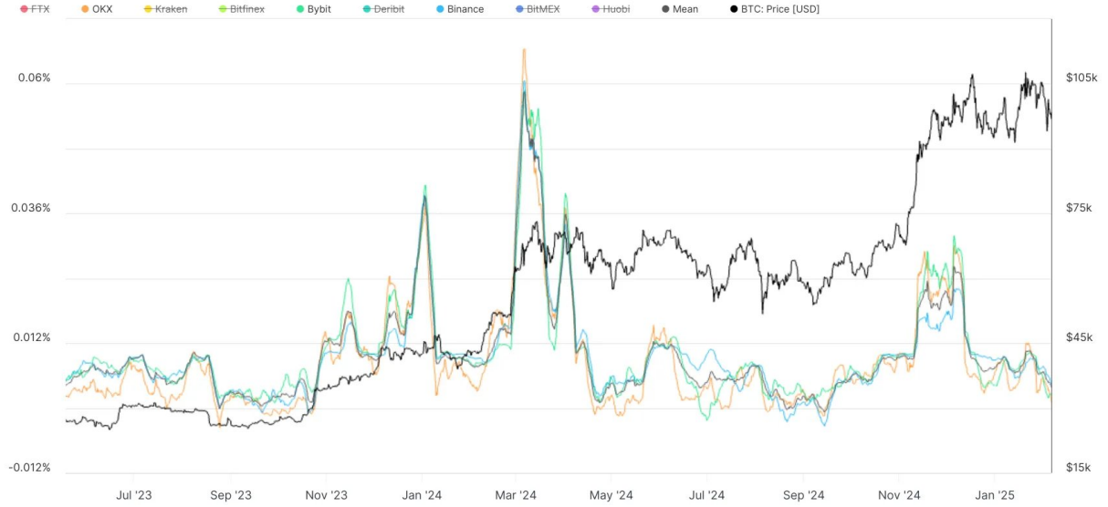
Futures Perpetual Funding Rate (All)