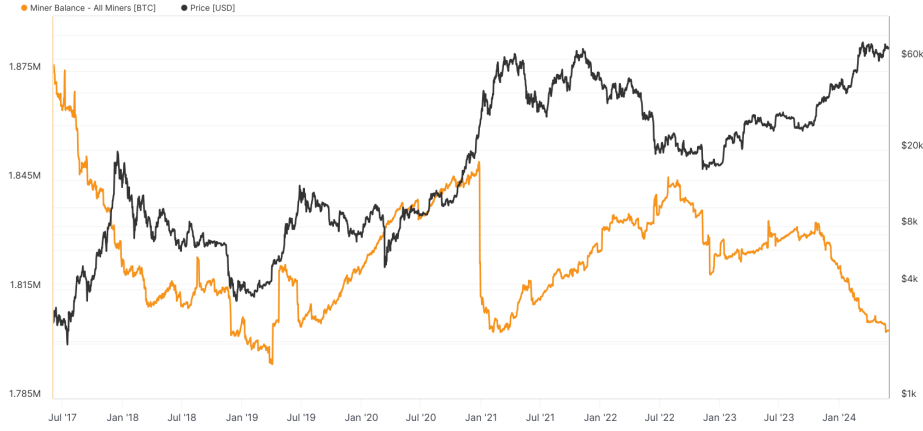
Bitcoin: Balance in Miner Wallets [BTC] - All Miners