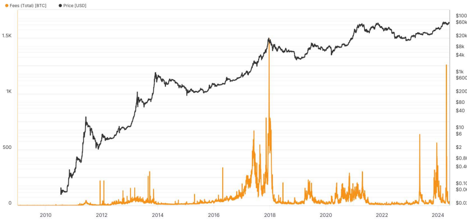
Bitcoin: Total Transaction Fees [BTC]