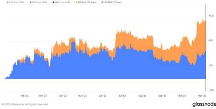
BTC and ETH Relative Performance vs Gold in 2023

Jeopolitik etkenlerden kaynaklanan hareketi ile altın son haftalarda en çok konuşulan yatırım araçlarından biri oldu. Altının fiyat hareketine baktığımızda ise 2023 yılı içerisinde Bitcoin'in altına oranla %94, Ethereum'un ise aynı süre zarfında altına oranla %44 daha büyük bir yükseliş gerçekleştirdiğini görüyoruz. Yani, en büyük iki kripto varlık 2023 yılı içerisinde bu yılın yıldızları olarak gösterilen varlıklarından altına oranla oldukça yüksek getiriler sağlamış durumdadır.